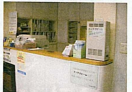
東京都監察医務院使用例